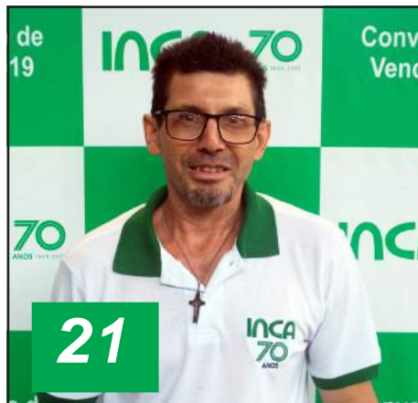
Natal de Lima