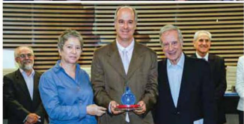
Equipe multifuncional da Metalúrgica Inca, responsável pelos projetos premiados na Fiesp