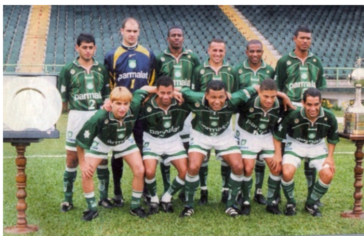
Palmeiras – Libertadores 1999. Na foto: Arce, Marcos, Roque Jr, Rogério, César Sampaio e Jr Baiano; Paulo Nunes, Zinho, Oséias, Alex e Zinho.